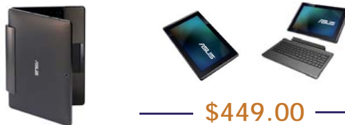
Clavier en sus